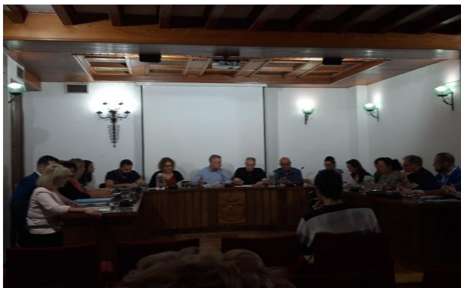
Un Momento del Pleno Extraordinario de hoy donde se ha aprobado la recepción de la Planta Desnitrificadora para su apertura

Todavía queda por resolver la situación de la doble red con acometida en la zona de Entrepins de conducciones con el desecho de los nitratos para el riego de jardines, y si se va a realizar una planificación para su extensión a todo el término municipal.